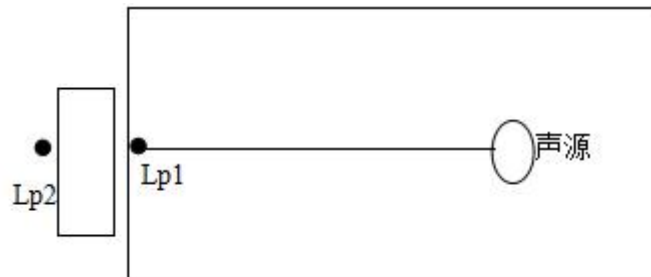
图 4-1 室内声源等效为室外声源图例